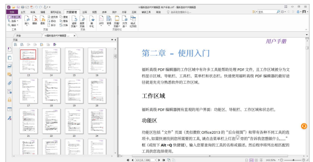
快速添加动态页眉页脚到PDF文档

福建福昕软件开发股份有限公司 地址: 福州市鼓楼区软件园G区5号楼 电话: 0591-38509898 传真: 0591-38509708 邮箱: sales@foxitsoftware.cn www.foxitsoftware.cn